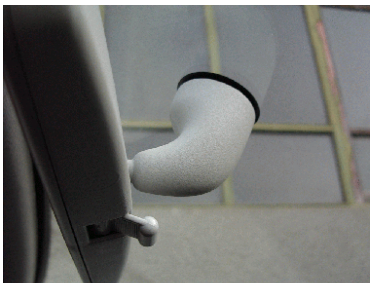
Posición original del espejo