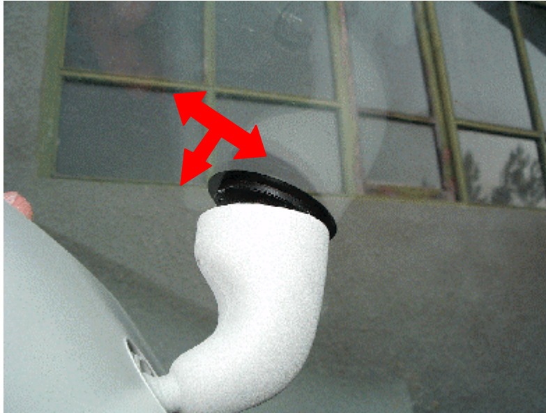
Balanceo para quitar el espejo

Para quitarlo tiraremos del espejo hacia el interior a la vez que realizamos un leve movimiento de arriba a abajo (techo a salpicadero). Sin ninguna dificultad tendremos en nuestra mano el espejo retrovisor.