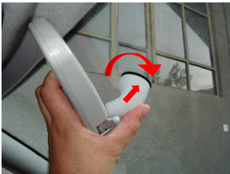
Roscando de nuevo el espejo

Para volver a colocar el retrovisor en su sitio no los haremos a presión, pues si ejercemos demasiada fuerza igual corremos el riesgo de cargarnos la luna. Lo haremos en forma de rosca. Colocamos el retrovisor de forma que las piezas de presión estén desenfrontadas y girando el retrovisor en sentido de las agujas del reloj (o viceversa, según como coloquemos el espejo) y con un ligera presión hacia el exterior habremos puesto el retrovisor en su posición original.